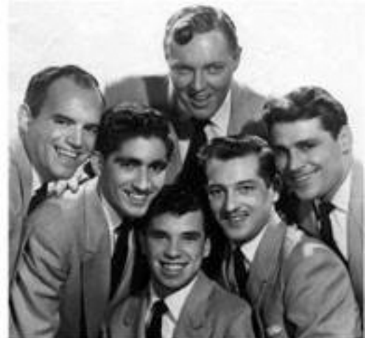
Bill Haley & the Comets.

Là où le rock'n'roll a été un savant mélange de culture blanche (pour le jazz et la country) et afro-américaine (pour le côté blues), le rockabilly est un style développé essentiellement par la communauté blanche du sud des États-Unis. À l'origine, le terme rockabilly était presque une insulte aux southern rockers (rockers du Sud) puisqu'il dérive du terme pour le moins péjoratif hillbilly (cul-terreux)... Concrètement, le rockabilly est un type de rock'n'roll utilisant quasiment systématiquement des effets de type slapback delay (délai court), tape delay (écho à bandes) et réverbération sur le son de la guitare. C'est un style également issu du mariage entre blues et country (il emprunte les progressions d'accords du blues et utilise des arrangements issus de la country). Mais les tempos sont globalement plus élevés que pour le rock'n'roll (jusqu'à l'extrême pour ce qui concerne le style psychobilly !). Le titre emblématique du rockabilly est sans nul doute Rock Around The Clock