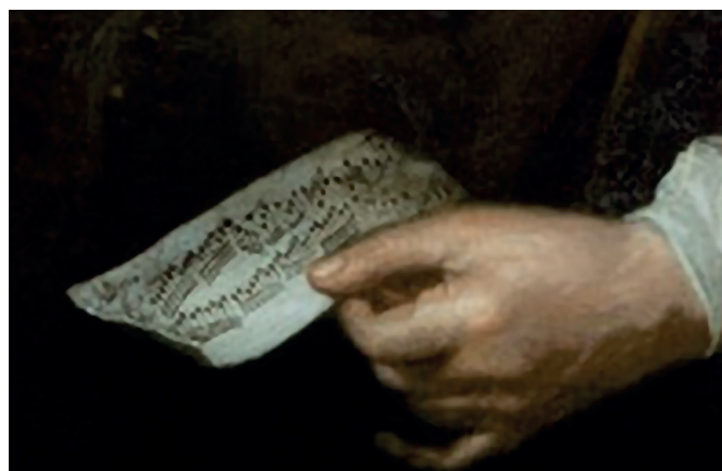
Gottfried Reiche, Elias Gottlieb Haussmann (1727)

The authorship of Abblasen is not certain. It could have been composed by Bach for Reiche, but was mostly likely composed by Reiche, whose works included 122 fanfares, tower music, 24 quartets, and 40 five part sonatas. None of his manuscripts have survived except for the quartets and this one fanfare via the Haussmann portrait.